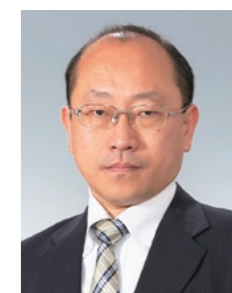
帝京大学可児高等学校 校長

ぜひ、本校の学校説明会等のイベントに足を運び、本校の様子 を肌で感じてみてください。皆様とお会いできる日を心より お待ちしております。